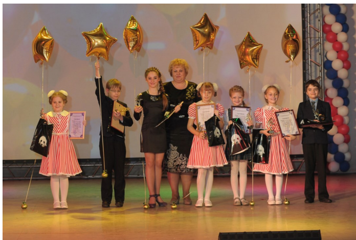
Победители фестиваля «Лидер – 2013» (начальная школа)