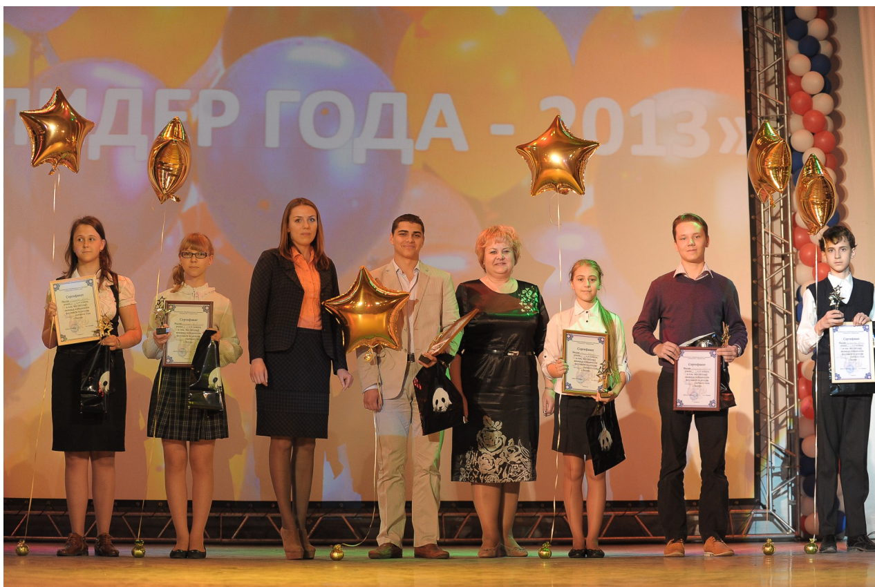
Победители фестиваля «Лидер – 2013» (средняя и старшая школа)